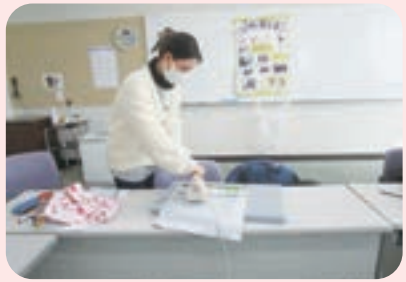
アイロンをかけて仕上げ

講師は裁縫のベテランボランティア6人。 裁縫を通して、参加者ママとボランティアが、和気あいあいと交流できました。