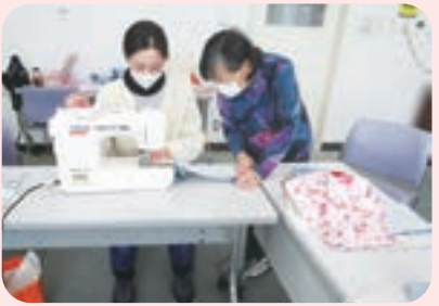
ボランティアとマンツーマンでミシンかけ