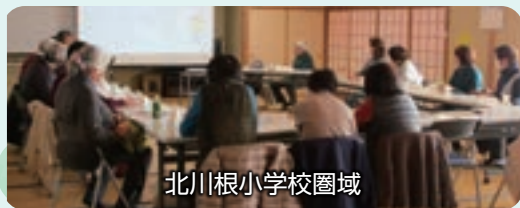
北川根小学校圏域

第1回目 は、まず事務局から生活支援体制整備事業の内容と、なぜ地域の話し合いの場が必要なのかを説明しました。