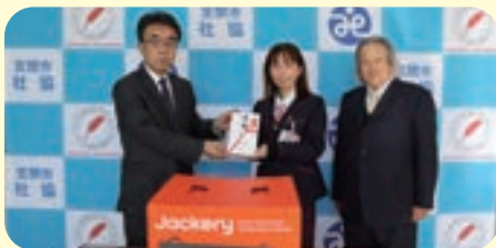
水戸ヤクルト販売(株)様より ポータブル電源と電源用ソーラーパネル