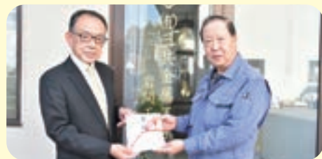
(有)三共金属工業所様より寄附金