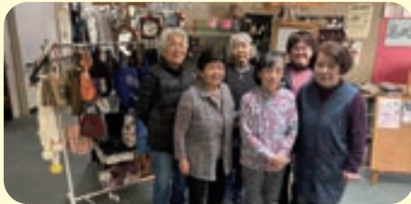
バザー夢工房様より寄附金