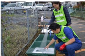
ボランティア活動終了後の洗浄のための消毒液を作る様子 (常陸大宮市)