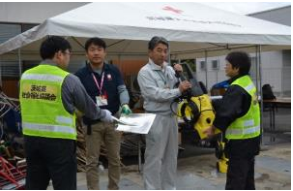
資機材を提供する様子 (常陸太田市)