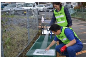
ボランティア活動終了後の洗浄のための消毒液を作る様子 (常陸大宮市)