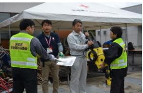
資機材を提供する様子 (常陸太田市)