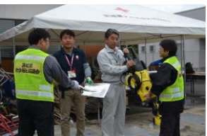
資機材を提供する様子 (常陸太田市)