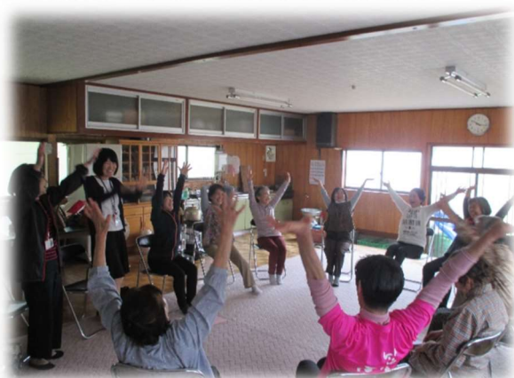
岩間地区「女子会なごみ」