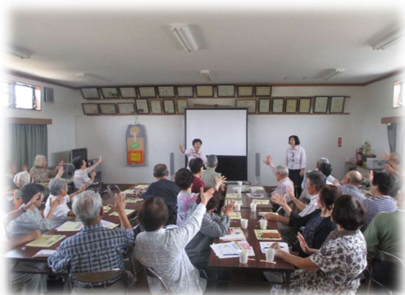
友部地区「ふれあいサロンなごみ」

※ 市役所のまちづくり出前講座や笠間市社会福祉協議会に登録しているボランティアさんに依頼することもお勧めします。