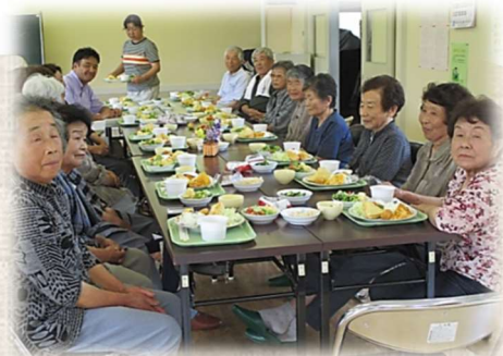
笠間地区「サロンいけのべ」

活動を円滑にするために、代表者（世話人）を決めることは必要ですが、代表者がひとりで考えたり、準備したりすることなく、みんなで協力して運営をしていきます。