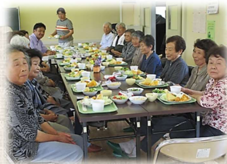
笠間地区「サロンいけのべ」

活動を円滑にするために、代表者（世話人）を決めることは必要ですが、代表者がひとりで考えたり、準備したりすることなく、みんなで協力して運営をしていきます。