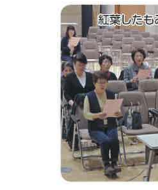
紅葉したもみじを想像しながら笑顔で合唱

最初の曲は「うさぎとかめ」で、歌う際にはうさぎやかめの気持ちになつて歌う。「もみじ」では、紅葉したもみじのイメージを想像しながら笑顔で合唱