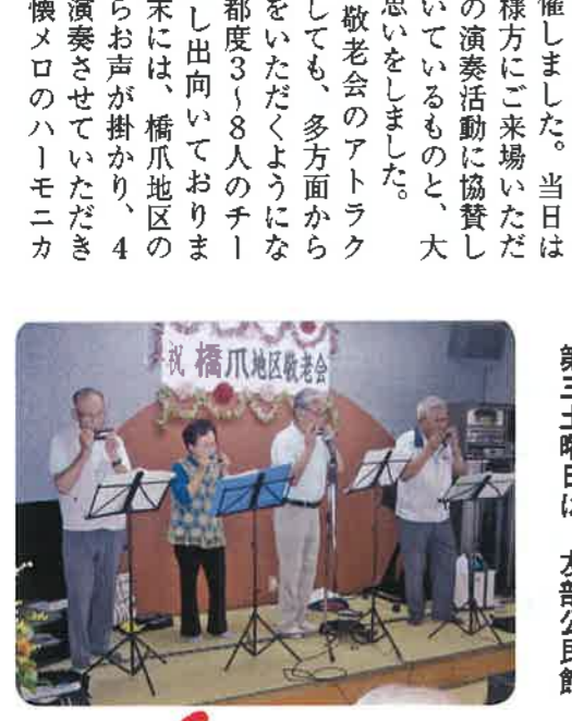
祝橋爪地区敬老会

最近では敬老会のアトラクションとしても、多方面から演奏依頼をいただくようになり、その都度3、8人のチームを編成し出向いております。9月末には、橋爪地区の敬老会からお声が掛かり、4人編成で演奏させていただきました。懐メロのハーモニカ