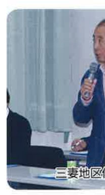
三妻地区代表のあいさつ

長)、支部役員、福祉推進員はじめ、多くのボランティアが、4部門で事業を実施しています。青少年健全育成委員会、地区懇談会の開催(6/24、7/9支部内14地区にて実施...出席者延388人)小・中・高校の先生も出席ものづくりわくわく体験(8/20)紙飛行機・竹で作った下駄・小物入れなど。小学生・幼児24人参加)