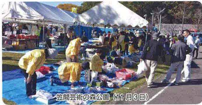
笠間芸術の森公園 (11月3日)