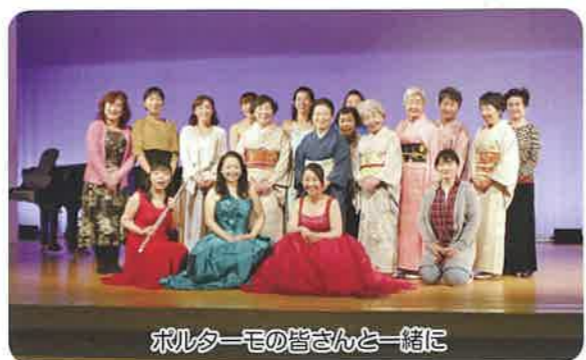
ポルターモの皆さんと一緒に

き寄せられる想いでした。演奏と歌声と踊りのステージは踊り手の指先からフロアー全体にも復興への心の表情を感じさせられました。それぞれの歌声に、また語りの中の様々な言葉に、そして心を込めた口調に何度も心を動かされました。そしてボランティア活動の中で、仲間と自分自身のしぐさの中で、「つむぐ」事への意識と続ける事の大切さをあらためて認識致しました。