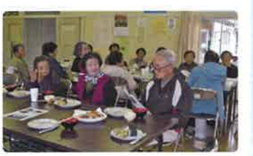
と行事が計画されていて、ライブ当日、テーブルの上には、社協ボランティアの手作りのおにぎり・天ぷら・みそ汁・漬物を用意されていた。最後に坂本九の「上を向いて歩こう」を歌った。

アコースティックライブが10月16日(月)池野辺公民館で開催された。ラ・ミッシェルは地元出身の2人組で10年前から活動している。出演を依頼したのが「サロンいけのべ」で地域のコミュニティの拠点である。