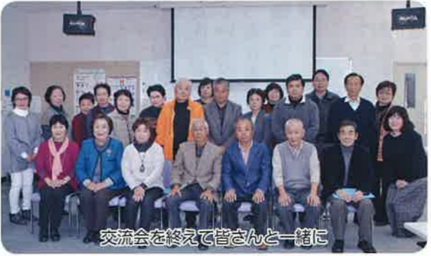
交流会を終えて皆さんと一緒に

「六戸支部だより」年3回発行(発行部数2300部) 今後に向けて支部長は「地域との理解を深め、出合いを大切に、知恵を出して笑