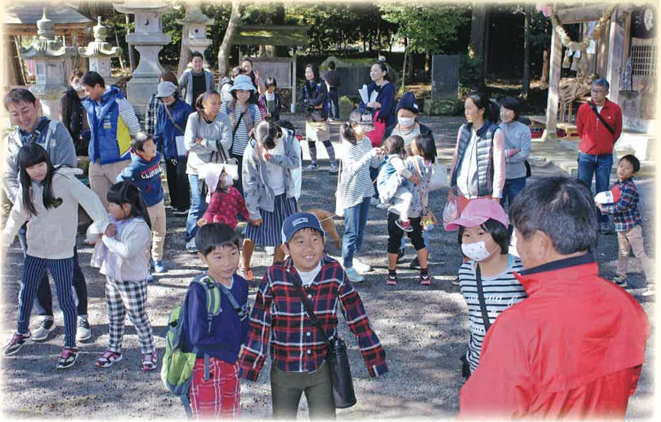
羽梨山神社でクイズに答える子ども達 (岩間西部地区)

社会福祉法人笠間市社会福祉協議会広報委員会 笠間市美原 3-2-11 TEL.0296-77-0730 E-mail info@kasama-syakyo.jp URL http://www.kasama-syakyo.jp/