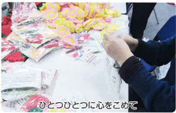
ひとつひとつに心をこめて

笠間市内には70歳以上のひとり暮らし高齢者が、約1600人おられます。そのひとり暮らしの高齢者の皆さんを対象に、地域の民生委員が各家庭を訪問し「見守り」ところのふれあい」を図る事業です。訪問先で会話をすることで、日頃の生活の不安や悩みを聞き、地域で孤立することのない安心した暮らしがお