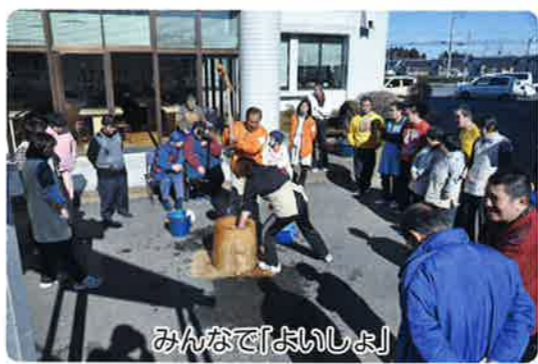
みんなで「よいしょ」

小正月が過ぎ、大寒を迎えた1月22日、お天気にも恵まれ、たけのこ・あおぞら合同の餅つき会が実施されました。毎年恒例の行事で、利用者の方もとても楽しみにしており普段の作業のときとは違った嬉しそうな表情を見ることが出来ました。