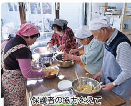
保護者の協力をえて

「よいしょ！」と元気な声が響き、同時に職員が持つ杵が振り下ろされます。時々利用者の方と交代しながら、「べったん、べったん」と餅をつく姿は本当に楽しそう