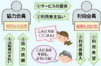
在宅福祉サービスセンター