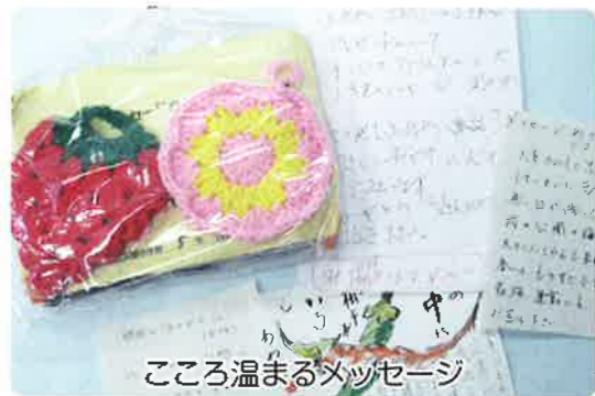
こころ温まるメッセージ