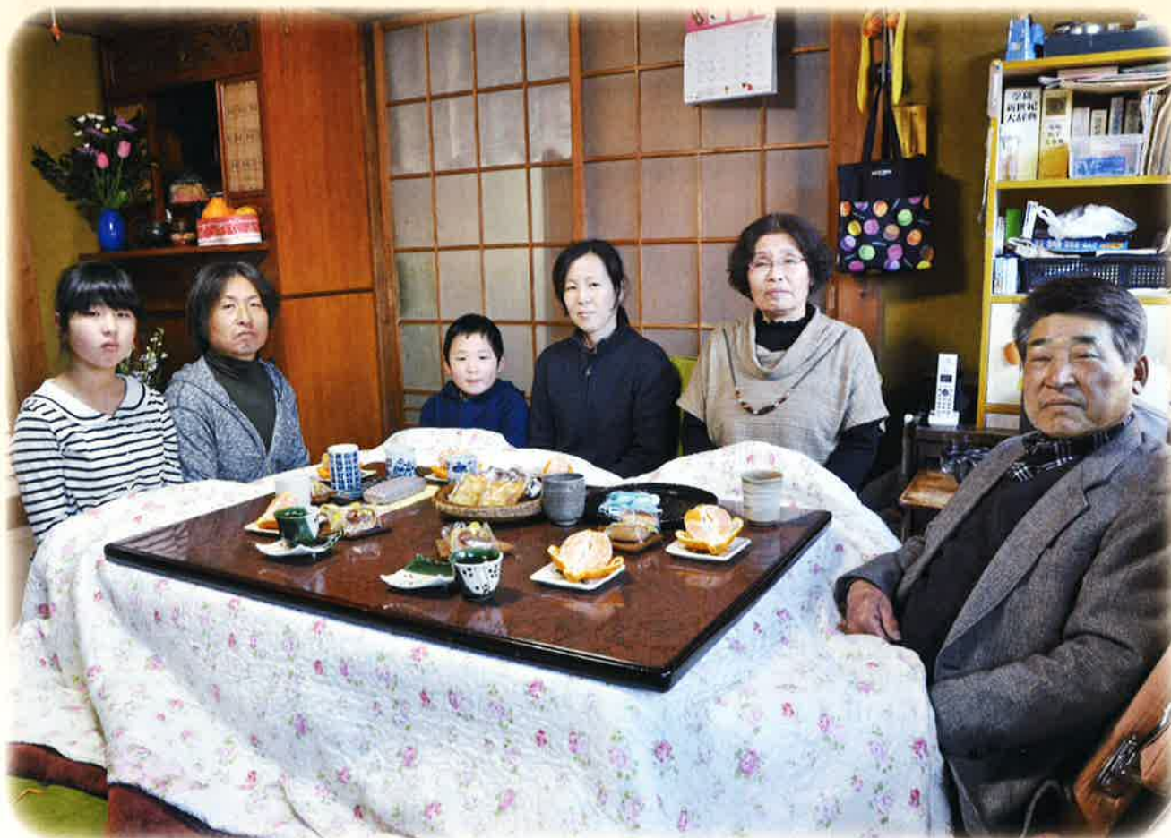
このときがいちばん幸せ 小嶋家(笠間地区)

社会福祉法人笠間市社会福祉協議会広報委員会 笠間市美原3-2-11 TEL.0296-77-0730 E-mail info@kasama-syakyo.jp URL http://www.kasama-syakyo.jp/