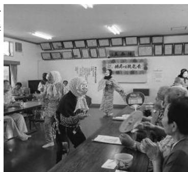
笑顔で握手ひよつとこ踊り

子ども会代表者6人から、メダルなどのお祝い品プレゼントがあり、元気いっぱいエール交換もありました。