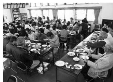
ホールでの楽しい会食

ホールの前庭では、お父さん方の杵つき餅と鉄板焼きそばのコーナーが設けられ、おいしそうなおいが周りにた