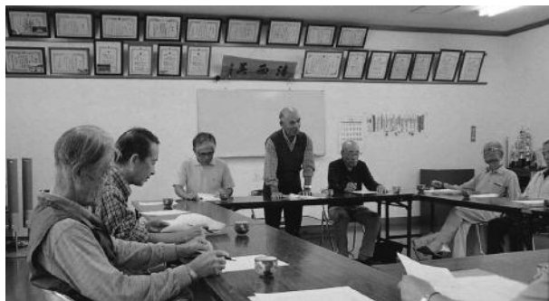
活発で充実した懇談会