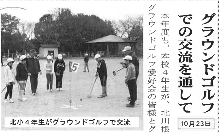
北小4年生がグラウンドゴルフで交流

本年度も、本校4年生が、北川根グラウンドゴルフ愛好会の皆様とグラウンドゴルフの交流会の機会をもつことができました。 児童は愛好会の皆様にルールや技を教えてもらい、会話を楽しみながら交流することができました。とても良い思い出となりました。また、地域の方々に児童の良さを発見してもらえよう機会にもなったことと思えます。 北川根小学校の児童は地域の皆様の温かい目に守られて日々、成長しています。今後もこのような活動を大切にし、学校と地域の交流を深めていけたらと感じています。 (北川根小学校 小松崎)