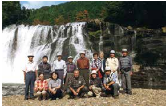
柿橋ミニサロン 龍門の滝

四十四人参加 十一月五日(木) 高齢者の食事学(配食弁当 の作り方)二十四人参加 ☆ 南友部ブロック「対話と食 事会」 十一月十四日(土) 二十八人参加