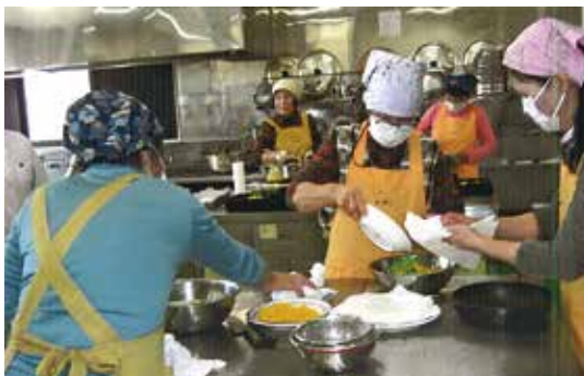
配食弁当の作り方