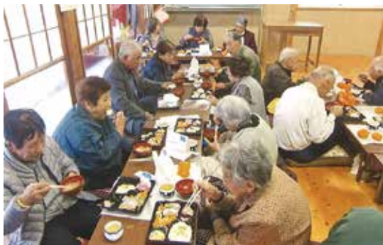
南友部 対話と食事会