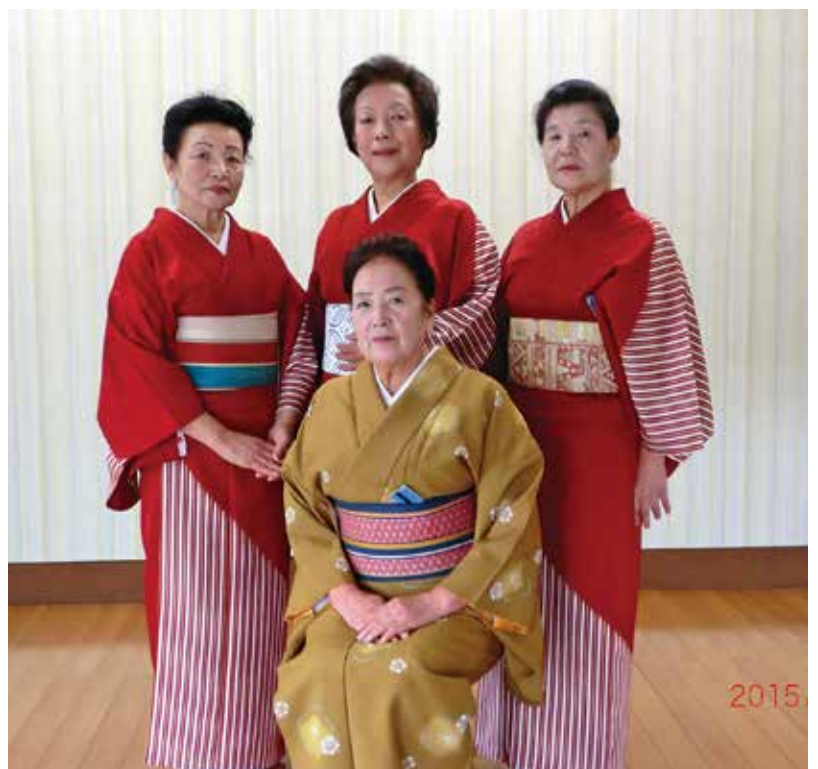
お弟子さん達と(前列 中央)

数年前から健康と体力づくりの為、週二回グラウンドゴルフへ御主人と出かけ楽しさが増えたそうです。前向きな姿勢と秘めたる芯の強さが何