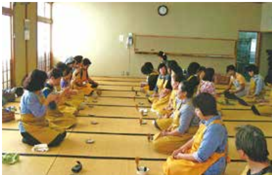
和菓子作りと抹茶席